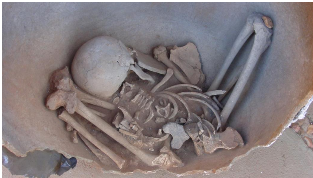
Figura 4: Sepultamento nº 4 – sepultamento primário de indivíduo acomodado sentado dentro da urna em posição fletida.