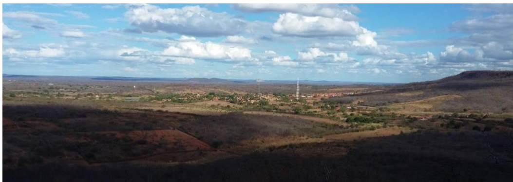
Figura 3: Vista panorâmica do município de São Braz.

artefatos arqueológicos. No município de São Braz do Piauí, precisamente na porção central da cidade, foram identificados vários indícios de ocupações por grupos ceramistas.