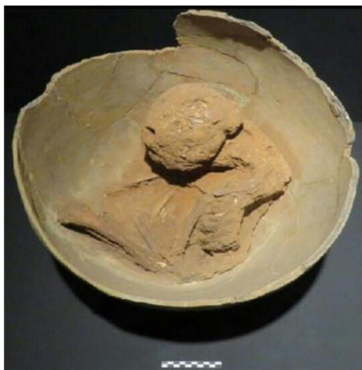
Figura 5: Sepultamento nº 5 – sepultamento primário de indivíduo acomodado em posição fetal em decúbito lateral esquerdo.

No que concerne às urnas funerárias, foi possível realizar a identificação nos sepultamentos acerca da composição – vasilhames contentor e opérculos, manufaturas, morfologias (através da reconstituição factual dos recipientes) e os tratamentos de superfície.