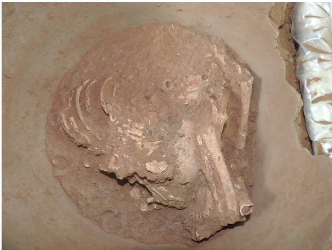
Figura 6: Sepultamento nº 7 – sepultamento primário de indivíduo acomodado em posição fetal em decúbito lateral esquerdo.

Com relação a composição das urnas, observou-se que duas entre as sete urnas encontradas no sítio apresentam opérculos, as demais eram compostas apenas pelo vasilhame contentor.